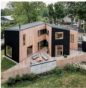
W māja “space in”