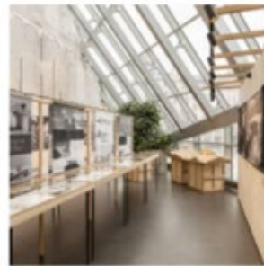
Process “Astra Zariņa — dabas spēks” Nodibinājums “Arhiteksti”