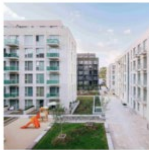
Viesturdārza kvartāls “RUUME arhitekti”